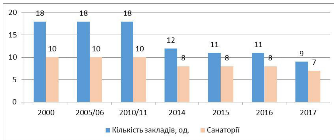
Рис. 1. Кількість санаторно-курортних та оздоровчих закладів у Тернопільській області (одиниці) (побудовано за [13])

Впродовж останніх років суттєво знизився рівень життя населення, тому спостерігається зменшення кількості громадян, які надають перевагу організованому оздоровленню та відпочинку.