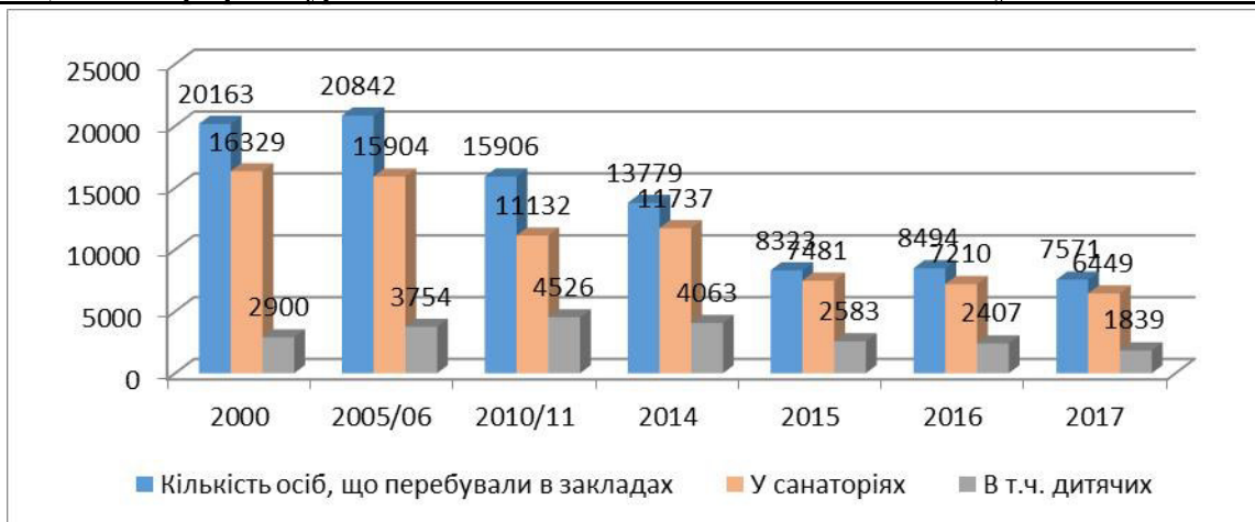
Рис. 2. Кількість оздоровлених осіб в санаторно-курортних та оздоровчих закладах Тернопільської області (тис. осіб) (побудовано за [5])

Аналіз статистичних даних дає можливість відслідкувати чітку тенденцію до зменшення кількості оздоровлених в області як дітей так і осіб старшого віку. Упродовж 2017 р. у санаторно-курортних та оздоровчих закладах області оздоровились та відпочили 7,5 тис. осіб, що майже втричі менше ніж в 2000 р. (рис. 2). Найбільша кількість осіб (4,6 тис.) оздоровилась у санаторіях, у дитячих санаторіях (1,8 тис. осіб).