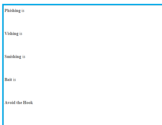
Рис. 4. Картка для заповнення дефініцій понять кожним студентом

Крок 1. Ознайомлення з існуючими додатками, що забезпечують безпеку користування онлайн-сервісами.