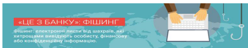
Рис. 2. Відповідь до завдання