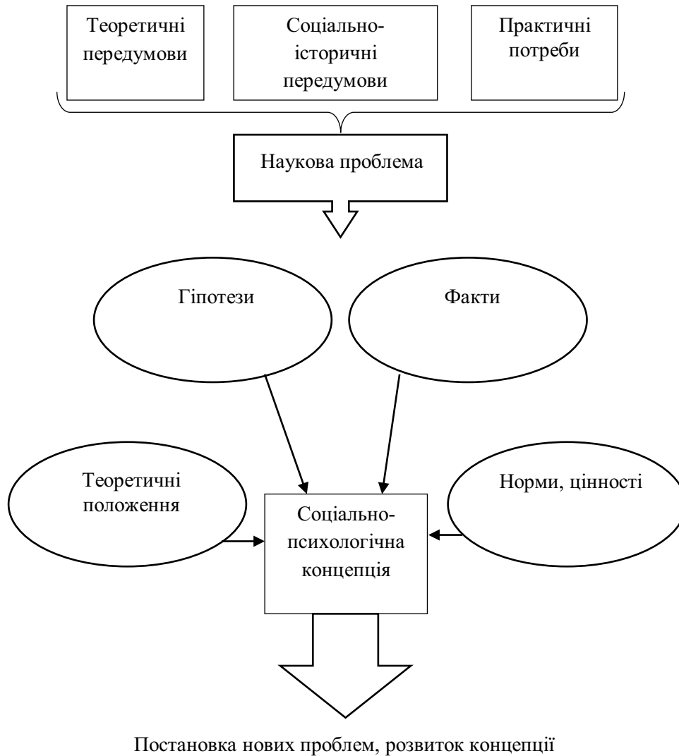
Рис. 1. Динаміка формування соціально-психологічної концепції.

Враховуючи вищезазначену специфіку, на нашу думку, композиційно висвітлення цієї концепції, як системи наукових знань і як форми подання результатів досліджень, повинно включати такі розділи: