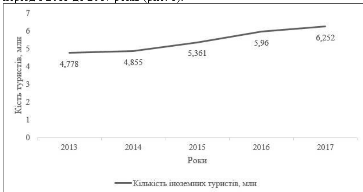
Рис. 1. Динаміка кількості іноземних туристів у Норвегії [2]

Розглянемо динаміку прибулих іноземних туристів до Норвегії за період з 2013 до 2017 років (рис. 1).