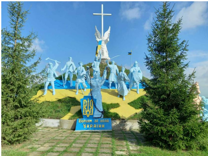
Рис. 3. Пам'ятник-кенотаф «Борцям за волю України»