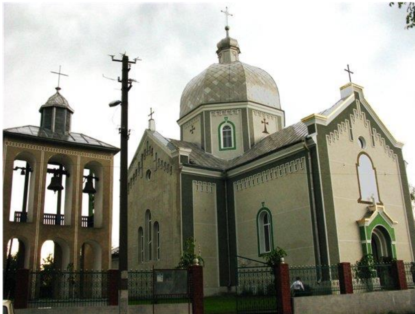
Рис. 2. Церква Святого Михаїла

[ https://andy-travel.com.ua/sites/default/files/001_17.jpg ]