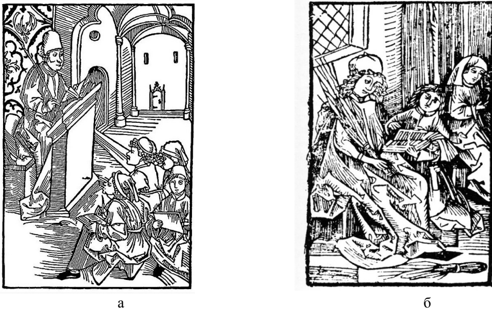
Рис. 1. Типи навчальних сюжетів епохи Відродження: а – Альбрехт Дюрер “Учитель з учнями”; б – Гравюра з титульної сторінки Вацлава Брейка “Vocabularius rerum”, 1487 р.

Та більшість із навчальних закладів та вихователів залишаються незмінними. Спостерігати це можна в роботі “Єлизаветинська школа” (рис. 2). Вчитель-монах, як і раніше, сидить з лозиною, а учні, стоячи перед ним, розказують вивчене. А також у гравюрі “Порка”. Із флорентійської гравюри”, близько 1500 р. (рис. 3). Вчитель сидить у своєму кріслі, з якого проводить “виховний процес” – дає прочуханки неслухняному учню. Учні зі страхом у очах намагаються працювати. Вони сидять за столом Г-подібної форми, який можна спостерігати й на роботах митців більш ранніх епох, наприклад “Школа Середньовіччя” (рис. 4). Можна спостерігати кесонну стелю. Кесонними прийнято називати вигляд дерев’яних підвісних стель, які складаються з прямокутних або квадратних панелей [5].