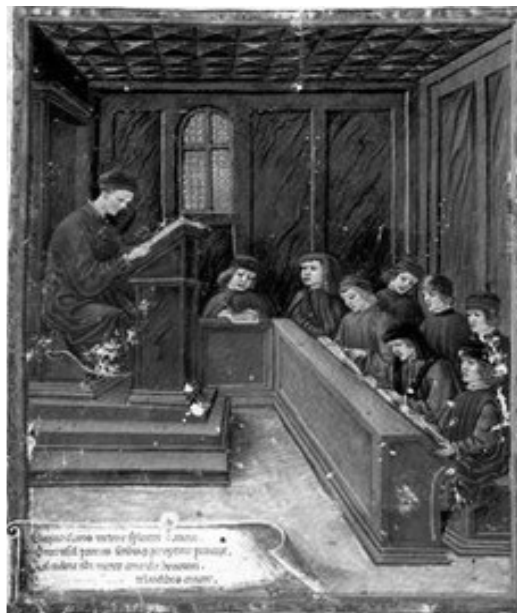
Рис. 4. “Школа Середньовіччя”

Наступна робота даного дослідження, що розглядається в межах аналізу навчальних інтер'єрів та проявів у них виховних ідеалів суспільства зазначеного часу, є “Вивіска для вчителя” 1516 р. (рис. 5).