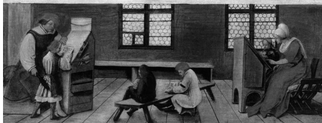
Рис. 5. “Вивіска для вчителя”. Ганс та Амброзіус Гольбейни, 1516 р.

Wer Jemandt hie Der gern welt lernen Dütlich schreiben und läsen us dem aller kürztziten grundt den Jeman erdentken kan Do durch ein jeder der vor nit ein büchstaben kan der mag kürztlich und bald begriffen ein grundt do durch er mag von jm selbs lernen sin schuld uff schribē und läsen und wer es nit gelernen kan so ungeschickt weert Den will ich vñ nit und vergeben gleret haben und ganz nit von jm zu lon nemen er sig wer er well burger oder hantwercks ge sellen frouwen und junckfrouwen wer sin bedarff der kum har in der wirt driuwlich gleret vñ ein zimlichen lon. Aber die junge knabē und meitlin noch den frouwalten wie gewonheit ist .1516.