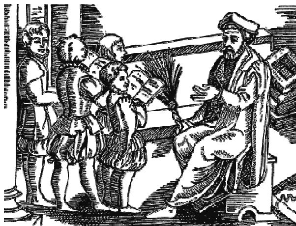
Рис. 2. “Єлизаветинська школа”