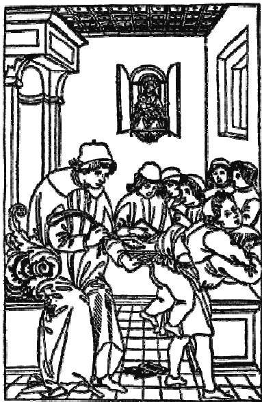
Рис. 3. “Порка”. З флорентійської гравюри, близько 1500 р.

Автор роботи зазначає, що в епоху Відродження кесонними стелями прикрашали імператорські палаци і замки. На зорі свого народження, таке заглиблення в стелі обов'язково прикрашалося складною декоративною різьбою, а поверхня покривалася золотом і позолотою. Такі складні конструкції створювалися не тільки для того, щоб підкреслити свій статус, але і для того, щоб можна було приховати стельові палі [5].