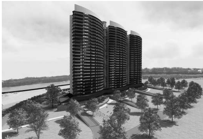
Рис. 2. Дячок В. Ю., Концептуальний проект житлового комплексу

Об'ємно-планувальне рішення квартир спрямоване на мінімізацію