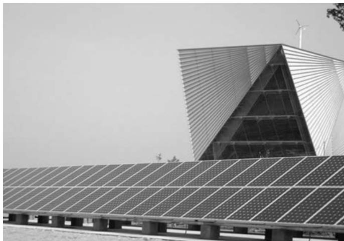
Рис. 1. Сонячні батареї будівлі CSET (фотографії Mario Cucinella Architects)

Провівши дослідження, ми бачимо, що у зарубіжній практиці для досягнення нульового балансу використовують енергію вітру, сонячні панелі за допомогою фотоелектричних батарей великих розмірів і вітряків, а також тепло землі і геотермальні джерела. У перспективі – використання нанотехнологій. Будівлі обладнують акумуляторами, що здатні накопичувати енергію. Важливою складовою енергоефективних будівель є повторне використання тепла, води, їх циркуляція. Великий резерв економії – це утеплення зовнішніх огорожувальних конструкцій.