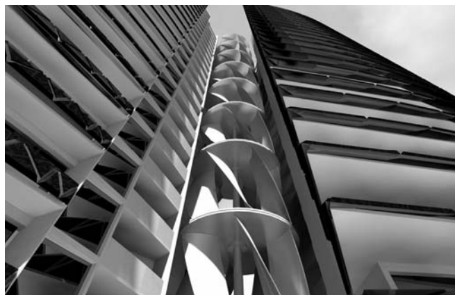
Рис. 3. Вітрогенератор